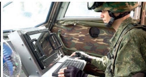
Коллективный элемент мобильной АСУ «АГАТ ТЗУ», установленный на бронев автомобиле.